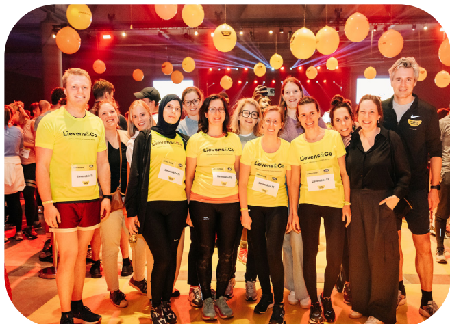
Runningshirts inclusief in het HR-pakket

** Maximum 30 flessen champagne inclusief.